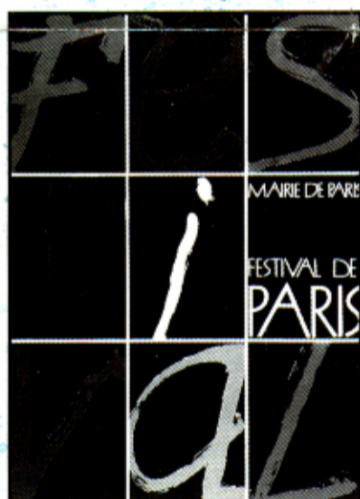
1988 : Création du 1 er festival de Paris.