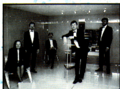
Les Octaves chantent Jacques Brel.