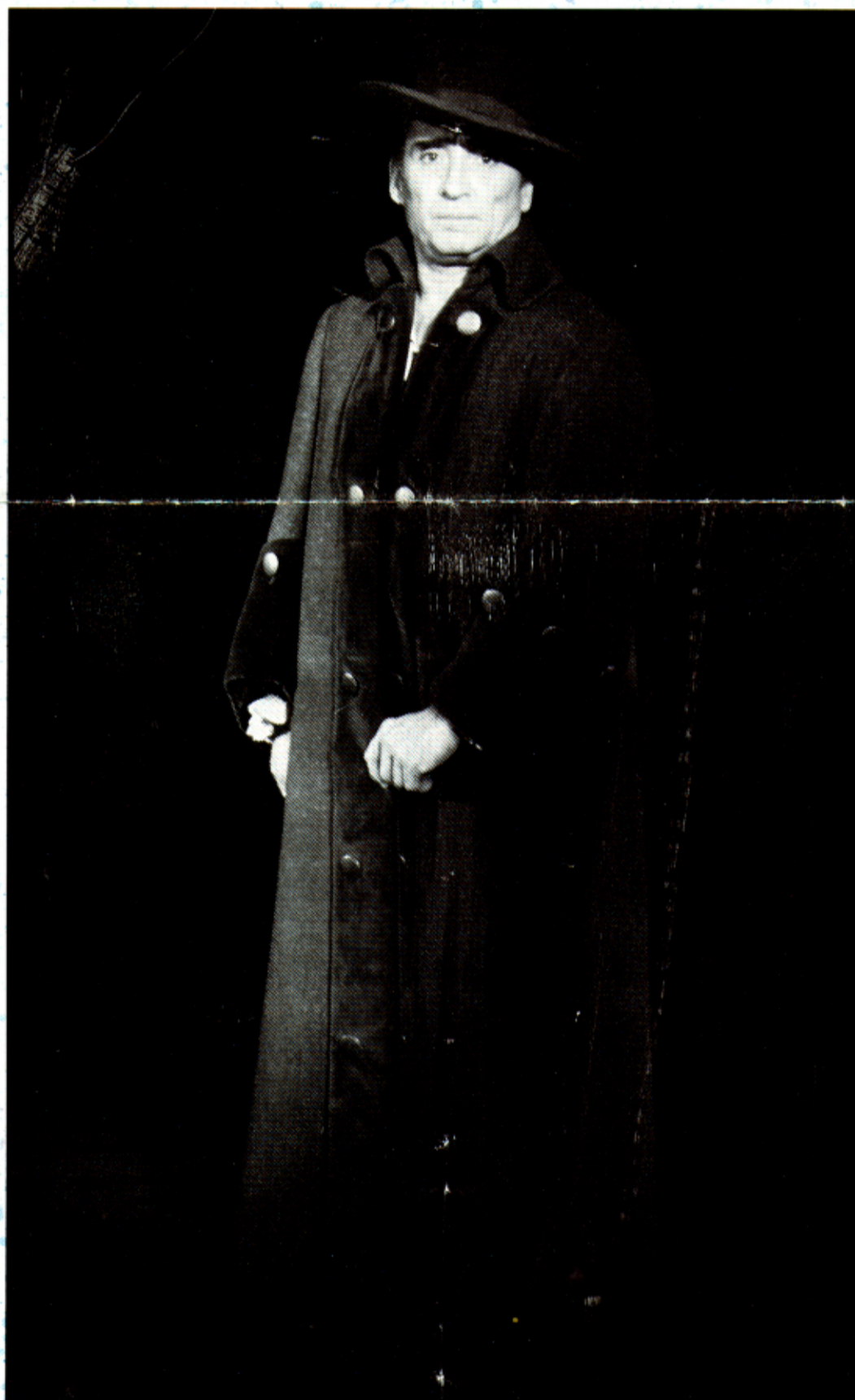
Reconnaissez-vous Claude Brasseur dans Georges Dandin ou le mari confondu, au Mogador ?

VARIETES MUSIQUE THEATRE CINEMA CONFERENCES DANSE